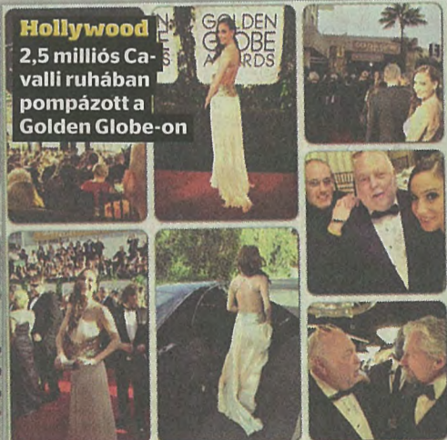
Hollywood 2,5 milliós Cavalli ruhában pompázott a Golden Globe-on