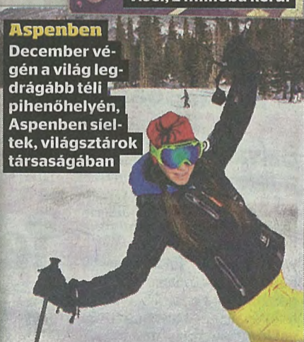
Aspenben December végén a világ legdrágább téli pihenőhelyén, Aspenben sieltek, világsztárok társaságában